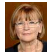
MARIE-GEORGE BUFFET Députée, ancienne Ministre

La liste du Front de gauche conduite par Pierre Laurent, Clémentine Autain et Eric Coquerel, nous permet d'emprunter un chemin pour une alternative à gauche. Elle est indispensable ! Le temps n'est plus à devoir choisir entre différentes facettes du libéralisme. L'heure est de choisir le droit au bonheur. Et c'est ce à quoi une nouvelle gauche peut et doit s'atteler.