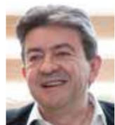
JEAN-LUC MÉLENCHON Député européen

Je m'engage aux côtés de la liste «Nos vies d'abord!» pour faire des élections régionales un vote de résistance et de libération. Citoyens : ne renoncez pas à votre bulletin de vote. Résistez à la mauvaise pente que prend notre pays, libérez le meilleur de vous qui veut le bien de tous ! Dites avec moi : Assez d'austérité, de haine et d'égoïsme ! Mettons la République, le partage et le respect de notre écosystème aux commandes des régions. Votre bulletin de vote est votre voix. Dites avec nous qu'un autre futur est possible en Île-de-France comme dans le pays.