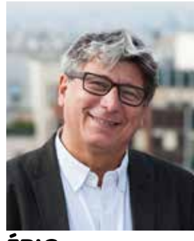
ÉRIC COQUEREL Paris