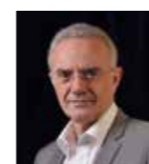
FRANÇOIS ASENSI Député

Nous devons reprendre nos vies en main en nous engageant pour une région plus humaine, plus solidaire, plus écologiste. Les inégalités se creusent, il est plus que temps de réagir et de dire aux citoyens que c'est possible, tous ensemble. Mettons toutes nos énergies en commun pour proposer de vrais changements. Battons-nous au quotidien pour le quotidien de tous.