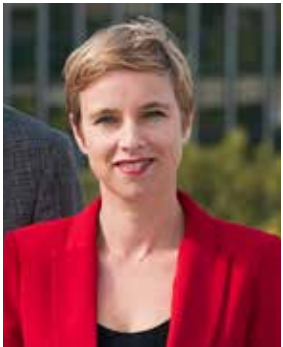
CLÉMENTINE AUTAIN Seine-Saint-Denis