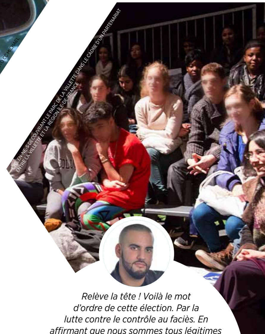
LYCÉEN-NES DÉCOUVRANT LE PARC DE LA VILLETTE DANS LE CADRE D'UN PARTENARIAT ENTRE LA VILLETTE ET LA RÉGION ÎLE-DE-FRANCE

Les élu-e-s du Front de gauche ont beaucoup œuvré pour la gratuité de l'éducation : manuels gratuits, aide à l'équipement en lycée professionnel, zone unique pour la carte imagine R... Nous poursuivrons avec la gratuité du matériel pour tous les lycéens de la voie professionnelle et la gratuité des transports pour les jeunes d'Île-de-France.