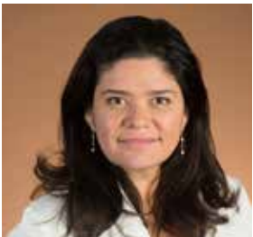
RAQUEL GARRIDO Hauts-de-Seine