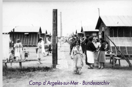
Camp d'Argelès-sur-Mer

En 1940, le camp de concentration d'Argelès-sur-Mer s'internationalise. Le régime de Vichy y interne des Nomades, persécutés par les nazis et les collaborateurs français, des réfugiés juifs étrangers, des étrangers « en surnombre » dans l'économie nationale ainsi que d'anciens membres des brigades internationales dont certains reviennent au camp après y avoir été internés suite à la Retirada. C'est l'histoire de cette seconde partie du fonctionnement du camp d'Argelès-sur-Mer qui sera mise en avant lors de la journée du samedi 22 février.