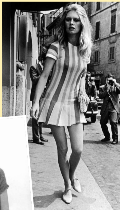
Rome (Italie), dans les années 1960. Vêtue d'une robe très courte, Brigitte Bardot marche devant l'Hôtel Forum, sous l'œil des photographes.

PAS D'ÉVOLUTION notable du côté des maillots. Mais on ose la scandaleuse minijupe, lancée depuis deux ans outre-Manche. Brigitte Bardot se balade sur la plage en robe mini rose et jaune, et dans un salon de coiffure de la capitale anglaise, on découvre Twiggy, littéralement « la brindille », mannequin emblématique des sixties, connue pour sa silhouette androgyne et ses longs cils noirs.