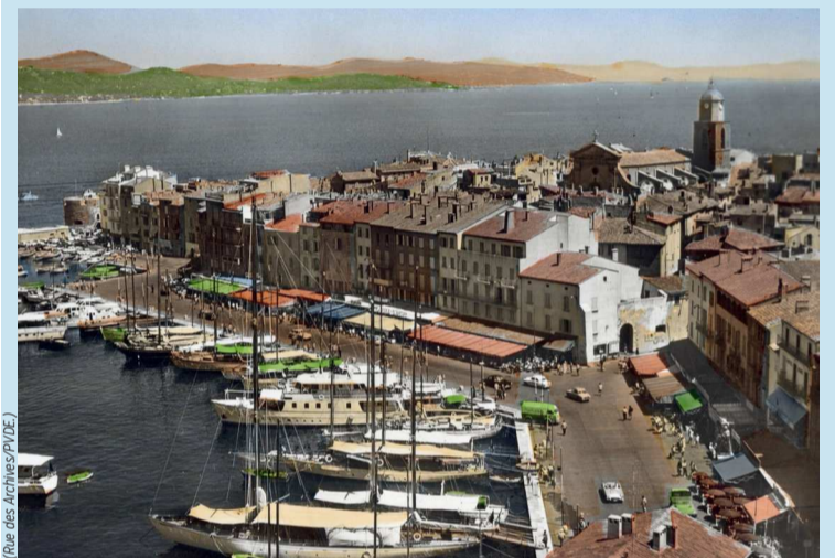
En 1966, Saint-Tropez est la destination à la mode par excellence.

ON PART se dorer la pilule à Saint-Tropez, la station à la mode. En 1963, Brigitte Bardot avait chanté les mérites de sa villa tropézienne dans « la Madrague », et, un an plus tard, « le Gendarme de Saint-Tropez » avait fait un carton dans les salles obscures. Alain Delon, Jean-Paul Belmondo et Sacha Distel viennent régulièrement se ressourcer sur place, et les touristes se pressent toujours plus nombreux « sur la plage abandonnée » (premier vers de la chanson « la Madrague »).