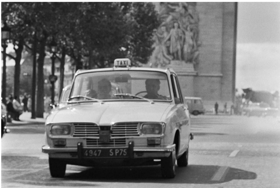
La R16 sera produite à près de deux millions d'exemplaires.