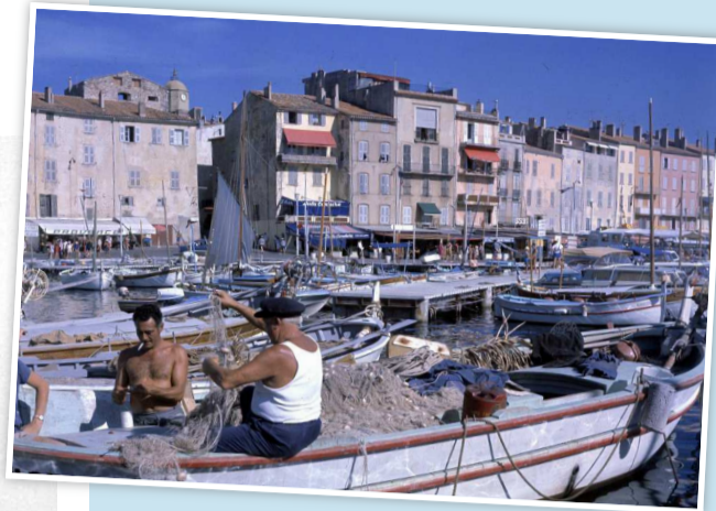
Saint-Tropez (Var), au début des années 1960. Dans le port de Saint-Tropez, des pêcheurs démêlent leurs filets.