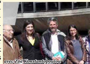
avec Zoé Konstantopoulou

Thierry AURY aux côtés de la Présidente du Parlement grec, lors du Forum européen des alternatives, le 30 mai à Paris. L'occasion de dénoncer ensemble les scandaleux intérêts payés aux banques par les communes, les PME, les hôpitaux publics, les services publics alors que toutes les banques d'Europe reçoivent l'argent à taux zéro de la Banque Centrale Européenne.