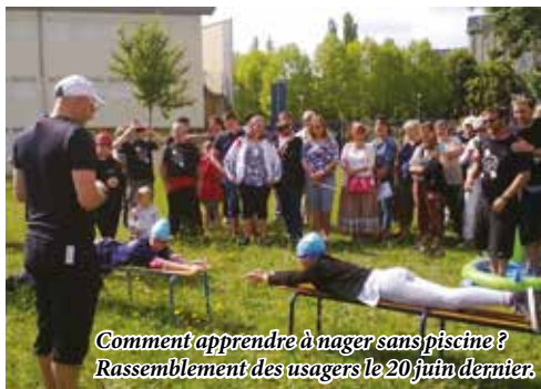
Comment apprendre à nager sans piscine ? Rassemblement des usagers le 20 juin dernier.

Nous demandons la rénovation ou la reconstruction de cet équipement indispensable au quartier Argentine et à notre ville.